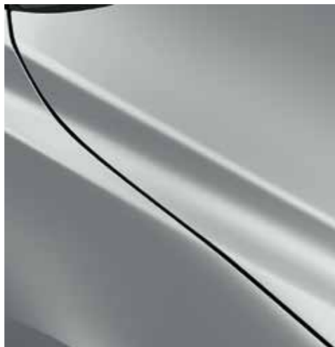
CERAMIC WHITE (47A) *