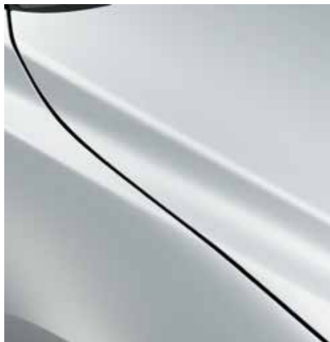
SNOWFLAKE WHITE (25D)*