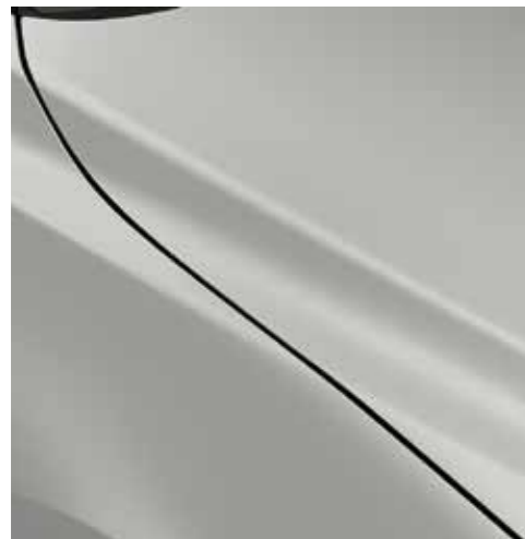
ARCTIC WHITE (A4D)