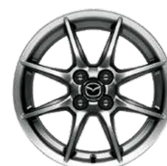
Jantes en alliage 16" 'Bright Dark' (design 158C) (SKYCRUISE Skyactiv-G 132 ch)