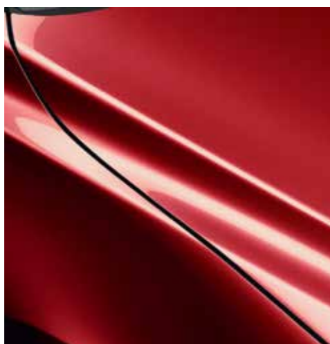
SOUL RED CRYSTAL (46V)*