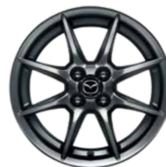
Jantes en alliage 16" 'Silver' (design 158) (SKYMOVE)