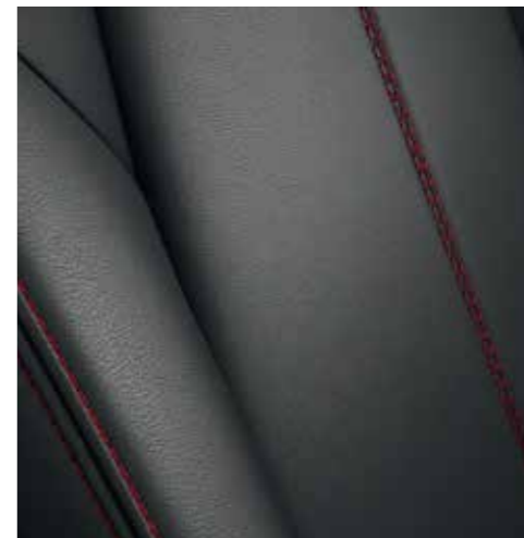
Cuir Noir avec surpiqûres rouges (SKYCRUISE)