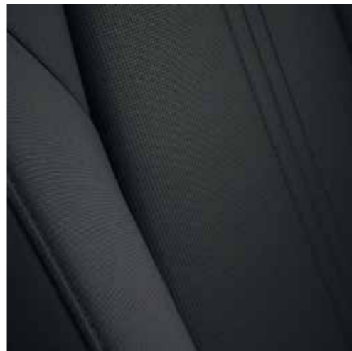
Tissu Noir (SKYMOVE)