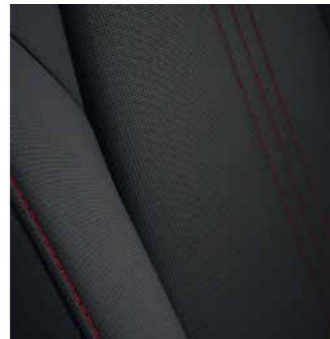
Tissu Noir avec surpiqûres rouges (SKYDRIVE)