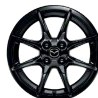
Jantes en alliage 16" 'Brilliant Black' (design 158B) (SKYDRIVE)