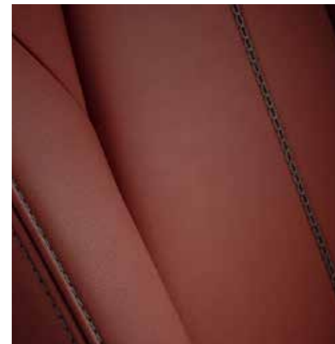
Cuir Nappa Takumi (cognac) (En option sur SKYCRUISE)